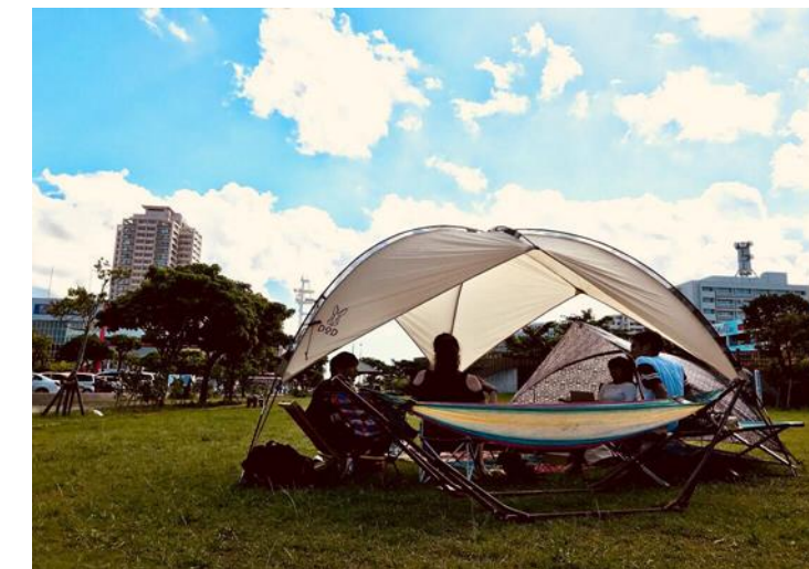
活動の様子(セミナー開催、トライアルプログラム実施等)